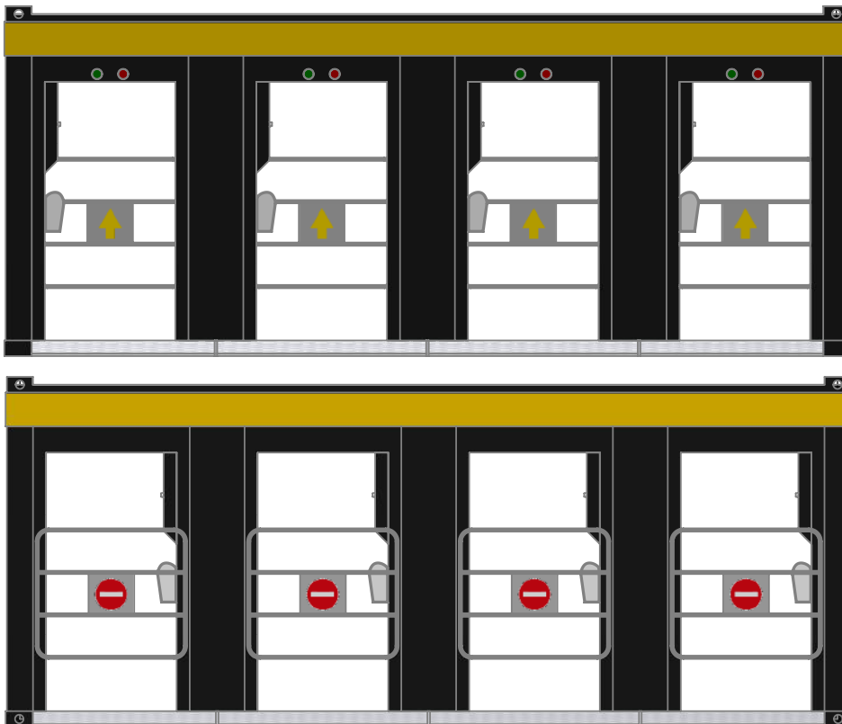
GATE STATION - VOORAANZICHT

Onze FIT 4 ENTRY-Gate Station is een container met geïntegreerde FIT 4 ENTRY-Gates . Het station omvat toegangscontrole en ingebouwde automatische gates met geautomatiseerde temperatuurmeting en geïntegreerde handreinigers . Dit zorgt voor een veilige en hygiënische omgeving voor zowel medewerkers als klanten.